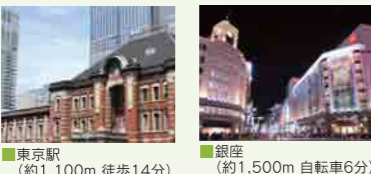
■東京駅 (約1,100m 徒歩14分)

東京駅は徒歩圏、その他のショッピングエリアへもスムーズにアクセスできます。また、毎日の買い物に便利なスーパーや、趣のあるカフェなど生活利便施設も揃っています。