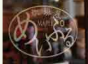
■珈琲屋めいぶる (約220m 徒歩3分)