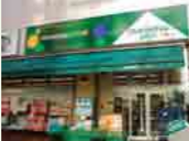
■マルエツ子 八丁堀店 (約200m 徒歩3分)