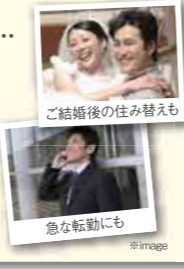
ご結婚後の住み替えも

Q. マンションが買い時なのは分かったけれど、やっぱり将来のことが不安... A. 将来は「賃貸」にも! BELLDUMOUR東京八丁堀は都心でも希少な駅徒歩1分という恵まれた立地に位置しています。例えば今回見学したBタイプ10階の部屋なら賃貸に出したとして得られる賃料はなんと 16万円! ご自身が住まなくなった場合も、収入源として立派な資産性を持つマンションなんですよ。 ※(株)ステーションプランナー査定による